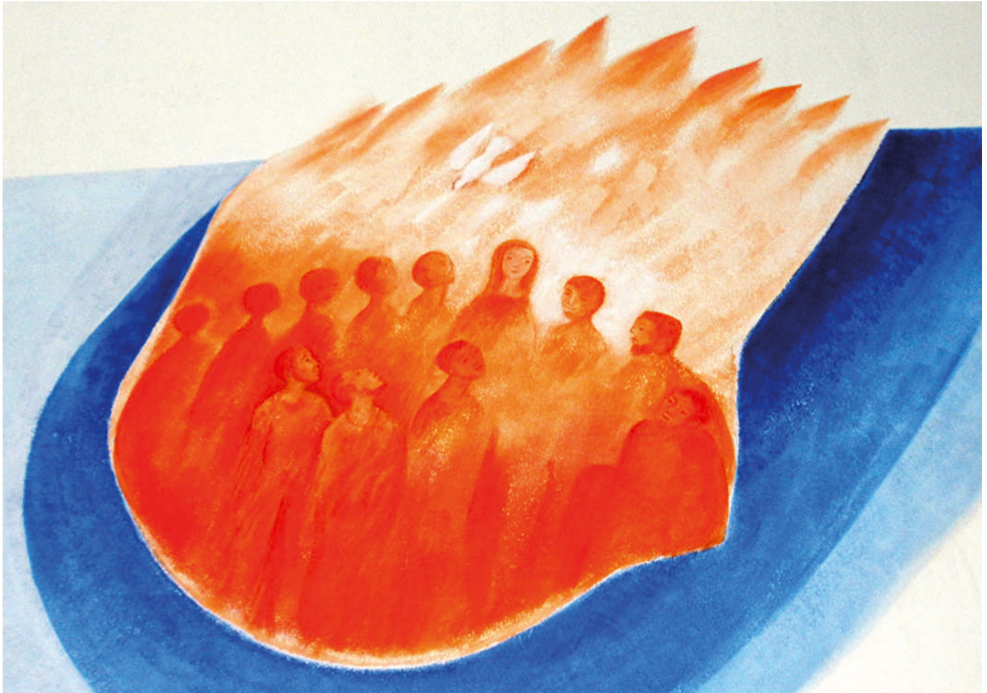
Künstler: Polykarp Uöhlein

Das Pfingstereignis aus einer anderen Perspektive