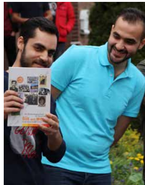
Junge Männer WG