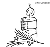
1. Advent: Die Umkehr wagen

Mt 24,37-44 Seid wachsam und haltet euch bereit.